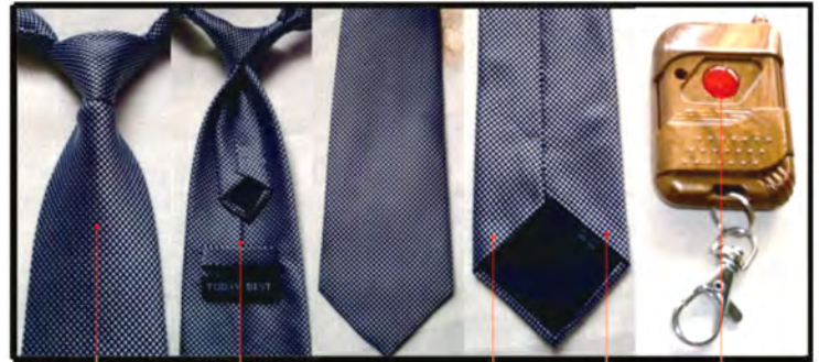
1 カメラ 2 USB接続ポート 3 LED 4 リセットボタン 5 電源・ファンクションボタン