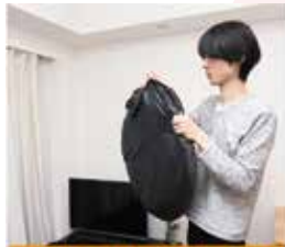
袋から本体を取り出す