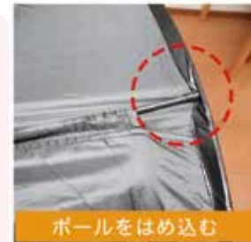
ポールをはめ込む

⑤ポールを本体のふちにはっきりとはめ込みます。この時、ポールがたわむことがあります、問題ありません。