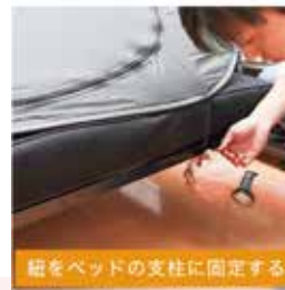
紐をベッドの支柱に固定する