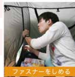
ファスナーをしめる