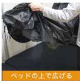
ベッドの上で広げる