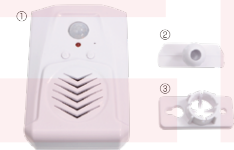
①本体 ②取付パーツA ③取付パーツB