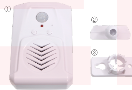
①本体 ②取付パーツA ③取付パーツB