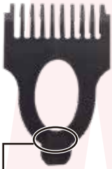
ここに高さが記載されています

②刈る高さに合わせてアタッチメントを取り付けます。アタッチメントにそれぞれの高さが記載されています。3mm/5mm/7mm から選んでください。