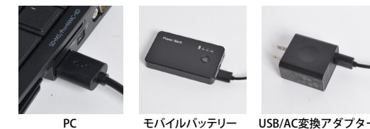
PC モバイルバッテリー USB/AC変換アダプター

PC・モバイルバッテリーからのUSB給電。USB/AC変換アダプター(別売)を使って家庭用コンセントから給電。