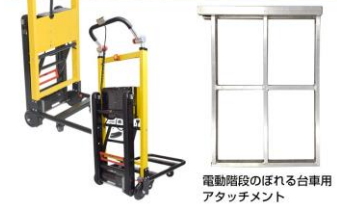
電動階段のぼれる台車用 アタッチメント