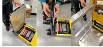
プレートを台車に取り付けて