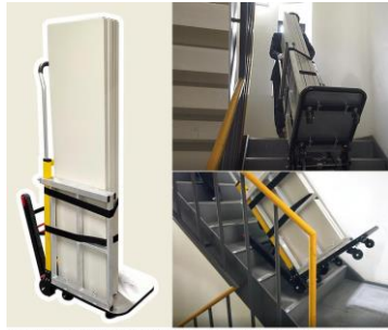
電動階段のぼれる台車/電動階段のぼれる台車/ハンドル可変タイプに 取り付ければ階段もラクに移動することができます