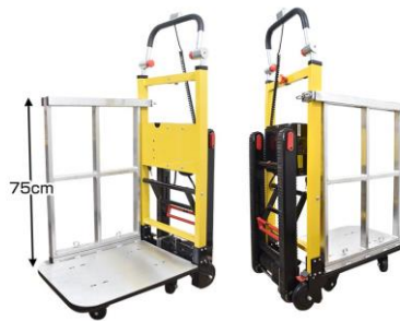
高さ2m 重量100kg程度までの荷物を運搬可能に