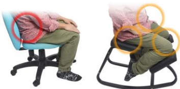
主に腰に負担がかかる 負担が膝などに分散される 腰痛でも座るのが楽になる！！