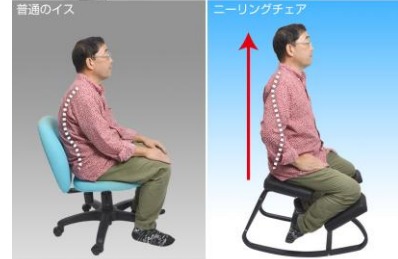
座るだけで自然に背筋が伸びる

腰痛で座っているのが辛い どうしても猫背になってしまう そんな時こそニーリングチェア！