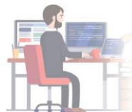
同じ体勢で座っていると 筋肉が固まる感じがする

ほんの2,3分 その場で動いて 体をほくしましょう！ ゆらゆら揺らす事が できます