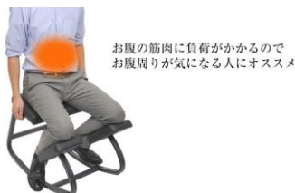
お腹の筋肉に負荷がかかるので お腹周りが気になる人にオススメ