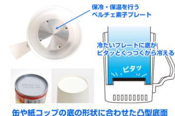
缶や紙コップの底の形状に合わせた凸型底面