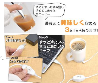
春夏秋冬ずっと使える!ドリンクホルダー

オフィスや車で時間が経っても冷たい&温かいのみものを飲みたい。USB で手軽に場所をとらずに使えるドリンククーラー&ウォーマー機能付きのカップホルダーです。