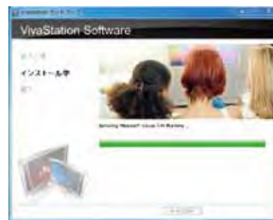
VivaStationインストール画面

※編集ソフト(CyberLink PowerDirector)の操作はサポート外となります。