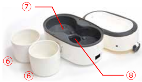
⑥炊飯容器 × 2 個(1 個最大 0.65 合炊き) ⑦炊飯台 ⑧スチーム発生板