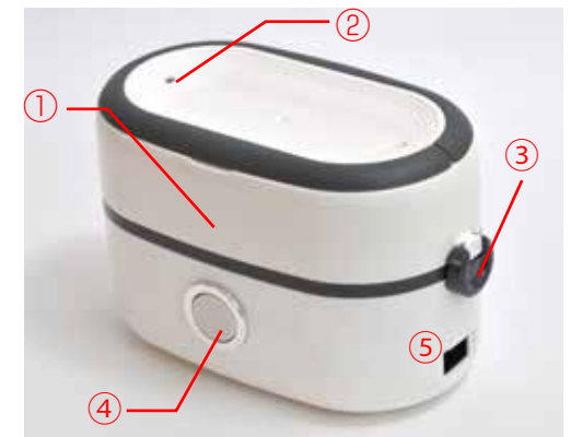
①炊飯台フタ ②蒸気穴 ③フタ固定用フック ④炊飯スイッチ ⑤電源コネクタ