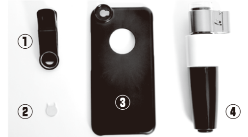
①スマートフォン用クリップ ②電池取替用器具 ③iPhone6/6s用ケース ④マイクロSCOOP