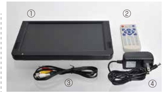
①モニター ②リモコン ③AVケーブル(100cm) ④ACアダプタ(150cm)