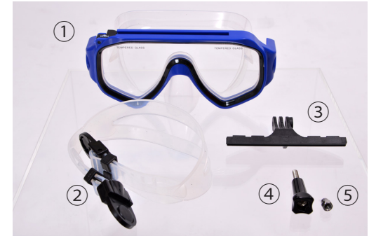
①本体 ②バンド ③ステー ④ネジ ⑤六角ナット