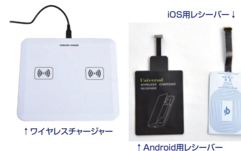
↑ワイヤレスチャージャー