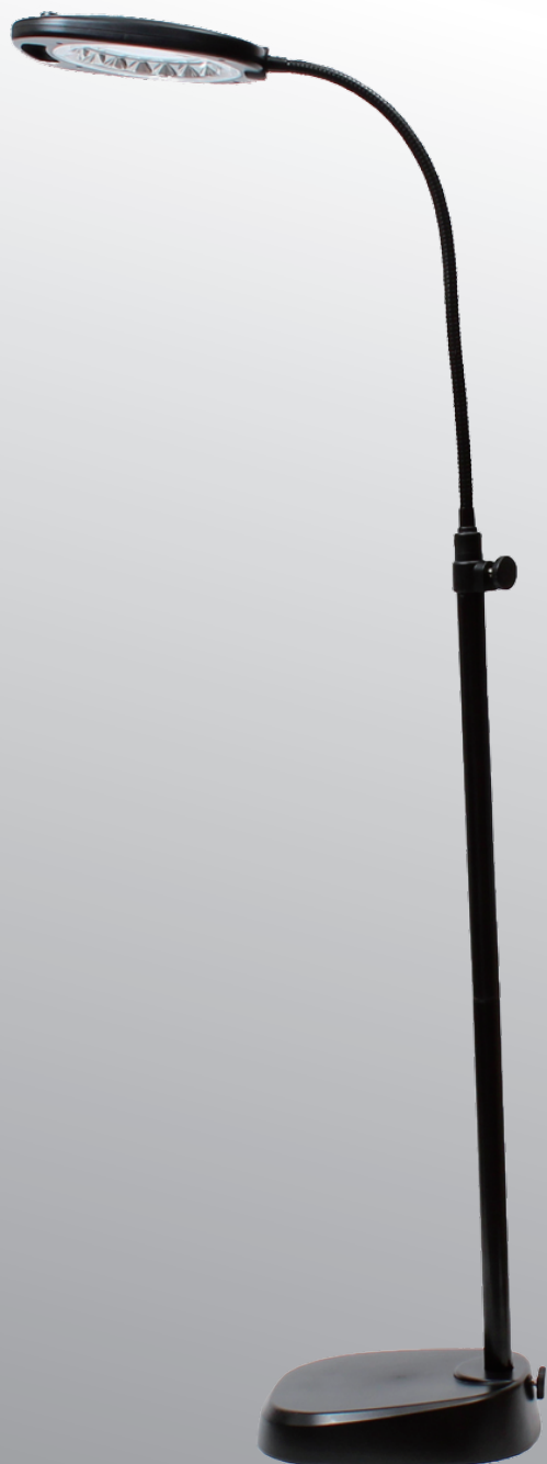
21LED 付き電池 / AC 両駆動スタンド式ルーペ