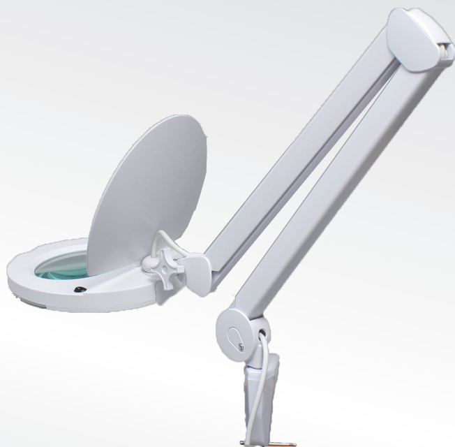
56LED 付きフレキシブルアームルーペ