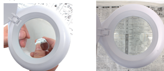
手元を明るく照らします

角度を自在に調整できますので、対象物にルーペを近づけて見やすい角度でお使いいただけます。もちろん手元を明るく照らす通常のLEDスタンドとしても使えます。