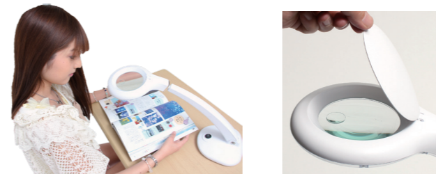
フタを閉じればスタンドライトに

スタンドタイプなので、自由に持ち運んで色々な場所でお使いいただけます。ルーペのフタを閉じれば通常のスタンドライトなので、普通の電気スタンドと作業用ルーペスタンドの1台2役をこなします。