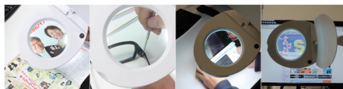
大型レンズを拡大鏡として 模型作りやハンダなどの細かい作業に 夜間・暗い場所でもライトが付いて安心 セード・アームは角度調整可能