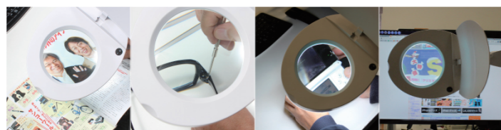
大型レンズを拡大鏡として 模型作りやハンタなどの細かい作業に 夜間・暗い場所でもライトが付いていて安心 セード・アームは角度調整可能