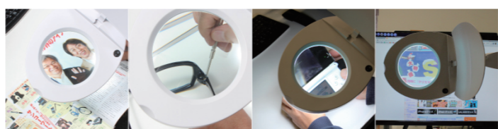
大型レンズを拡大鏡として 模型作りやハンタなどの細かい作業に 夜間・暗い場所でもライトが付いていて安心 セード・アームは角度調整可能