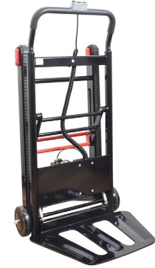
軽量電動階段台車60