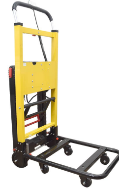
電動階段のぼれる台車