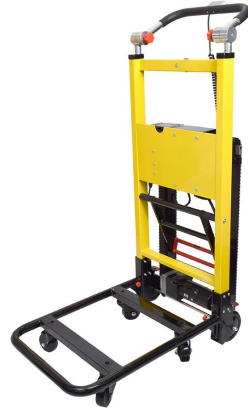
電動階段のぼれる台車ハンドル可変タイプ