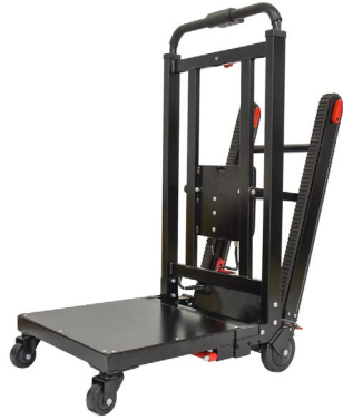
折り畳み電動階段のぼれる台車